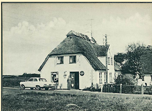
Købmand, Kegnæs. Postkort.

Både Als og Kegnæs ( Kenis ) er med, om end noget fortegnet.